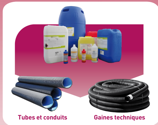
Tubes et conduits